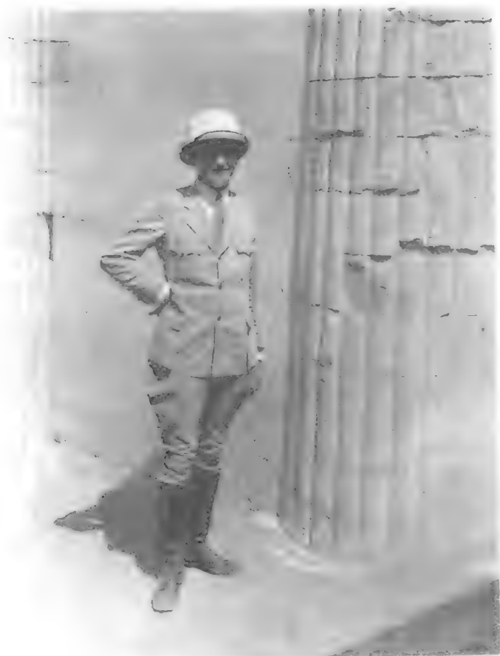
لوير عام ١٩٣١ أمام صالة الأعمدة التي كان يجرى ترميمها